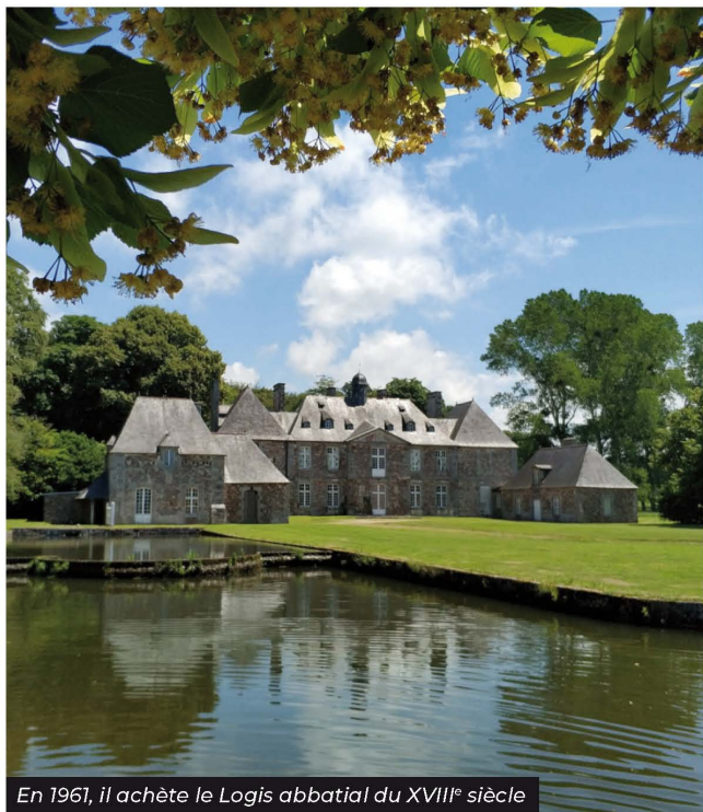
En 1961, il achète le Logis abbatial du XVIII e siècle