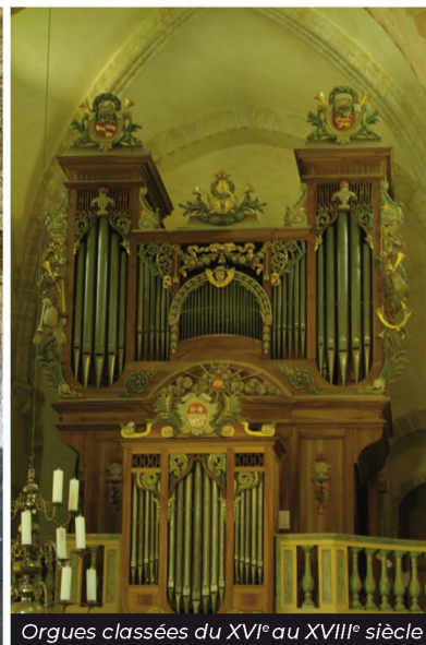
Orgues classées du XVI e au XVIII e siècle