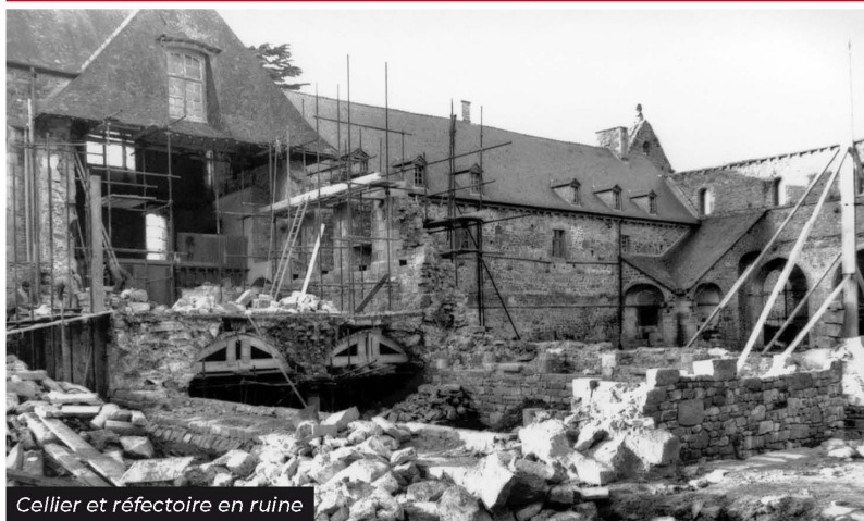
Cellier et réfectoire en ruine