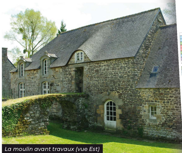
La moulin avant travaux (vue Est)