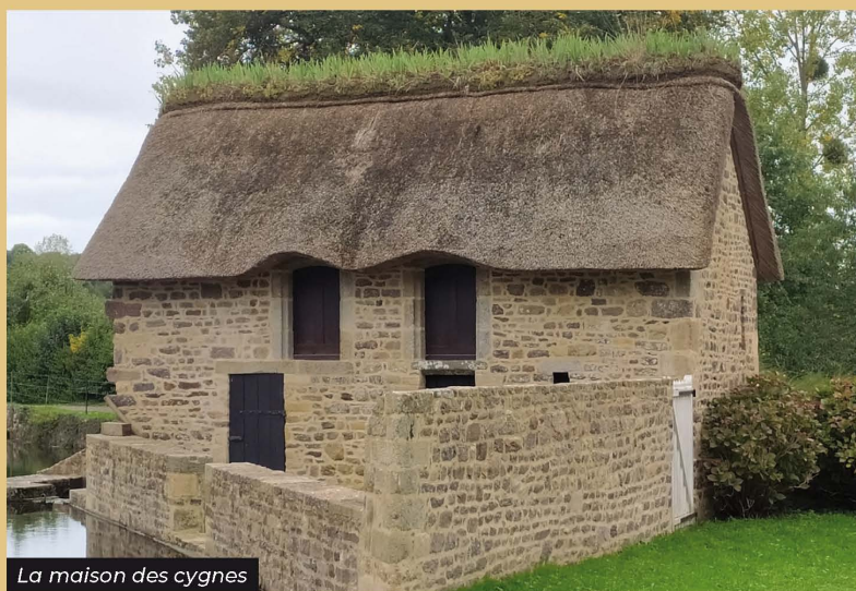
La maison des cygnes