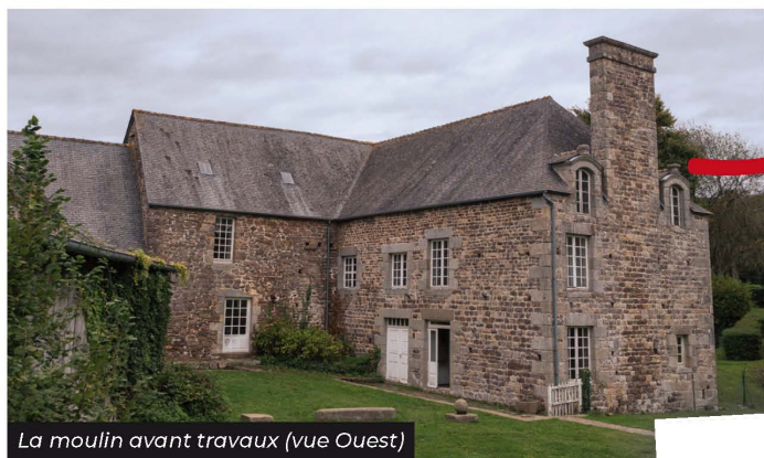
La moulin avant travaux (vue Ouest)