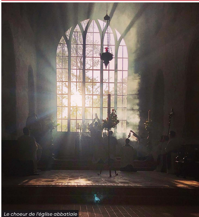
Le chœur de l'église abbatiale