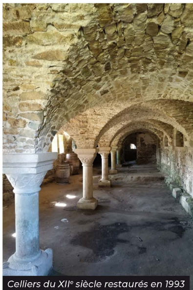
Celliers du XII e siècle restaurés en 1993