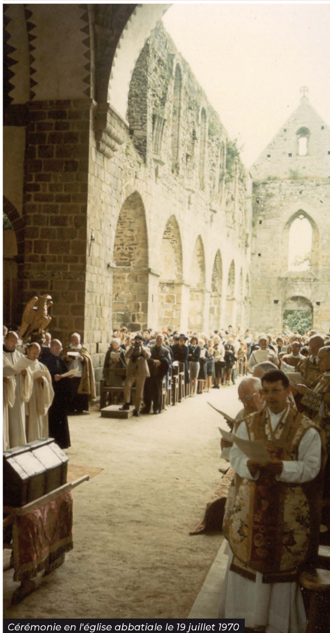
Cérémonie en l'église abbatiale le 19 juillet 1970